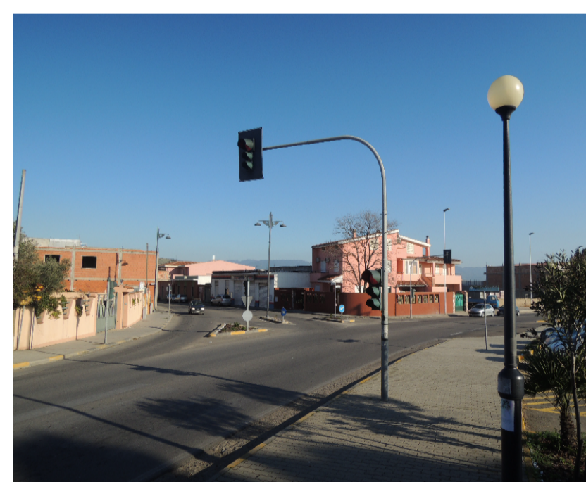
FASI DI ESECUZIONE DELLE OPERE