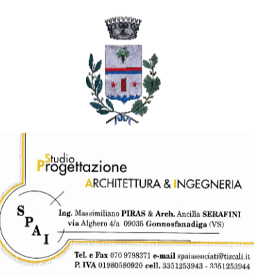
Tavola : 9