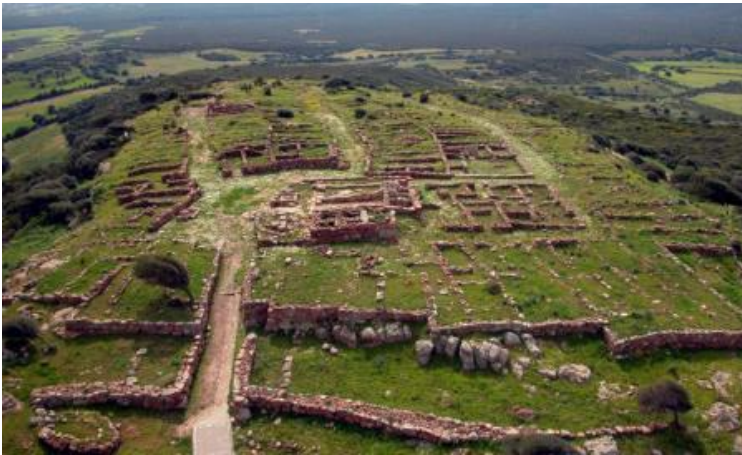
Situ de Mont Sirai

Torraus a su situ de Monti Sirai po chistionai de unu tèmpiu de su 725 i.C. dedicau a sa divinidadadi fenicia Astarte. Ant agatau innoi duus statueddas de sa dea Astarte e de su deus Bes, amigu de is pipius e protetori de sa maternidadi. In sa bidda acanta de su tèmpiu podeus ammirai s'architettura mista cun elementus a forma tunda nuraghesus e fàbbricus a sa moda orientali. Acanta de su de Monti Sirai nci at un'àteru situ de importu mannu. Una turri bècia nuragica est ingiriada de s'area industriali amministrada de ambadus is grupus. Ddui at unu murallioni dòpiu, nuraghesu e feniciu, po difendi is mèdius de produtzioni e is mèdius de lussu. Innoi s'oficina de s'imbirdi prus antiga de sa Sardigna, anca is artigianus traballànt cun tènnica fenicia, e sa còncia; in una pariga de màrigas ant agatau cracina, materiali imperau po conciai is peddis. Acanta de sa còncia, su laboratòriu de sa ceràmica fenicia traditzionali, coberta cun una pellicula arrùbia, creada cun acua e argidda. Su prodotu e su modellu econòmicu sardu de custu periudu tenint elementus nuraghesus e fenicius. Custu spiegant is repertus archeologicus agataus in custu situ.