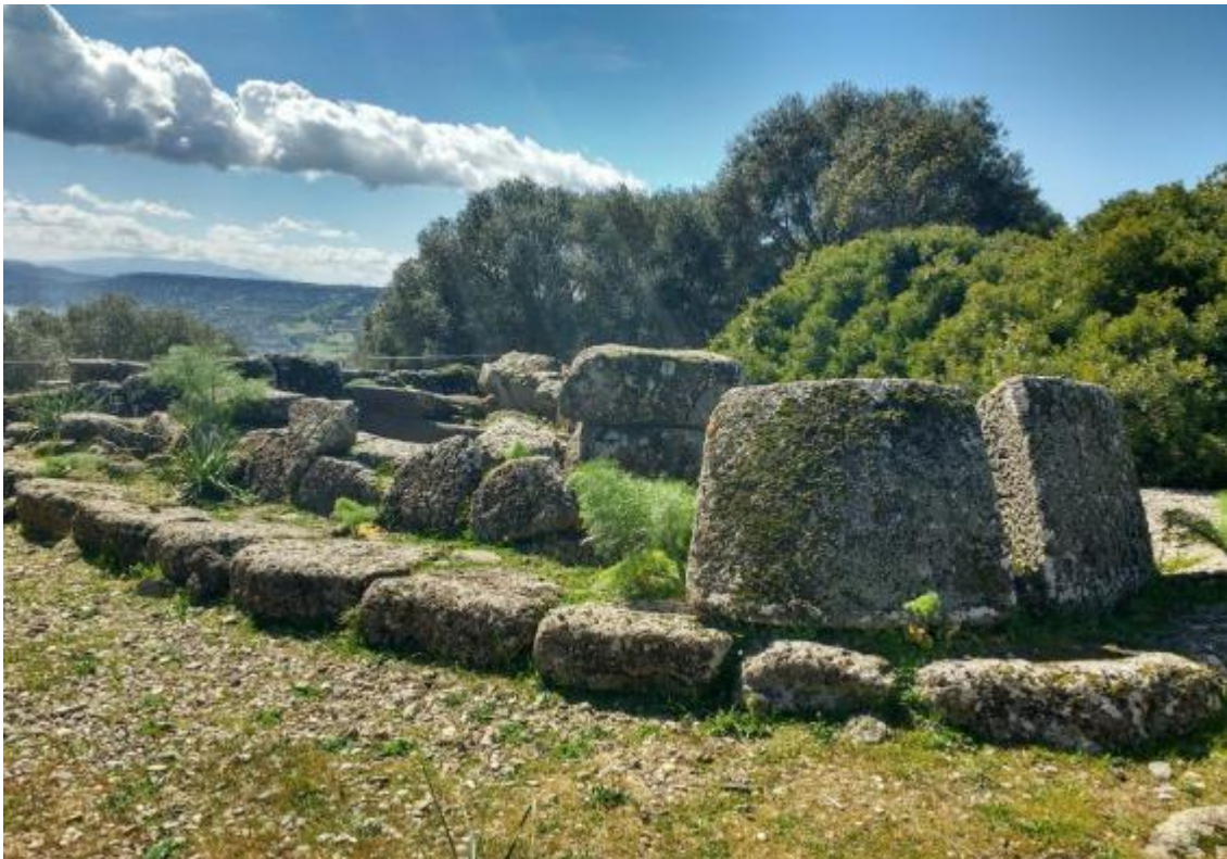
Nuraxi de Iloi_Sedilo