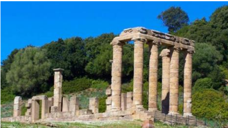
Tèmpiu de Antas_Frùmini Majori