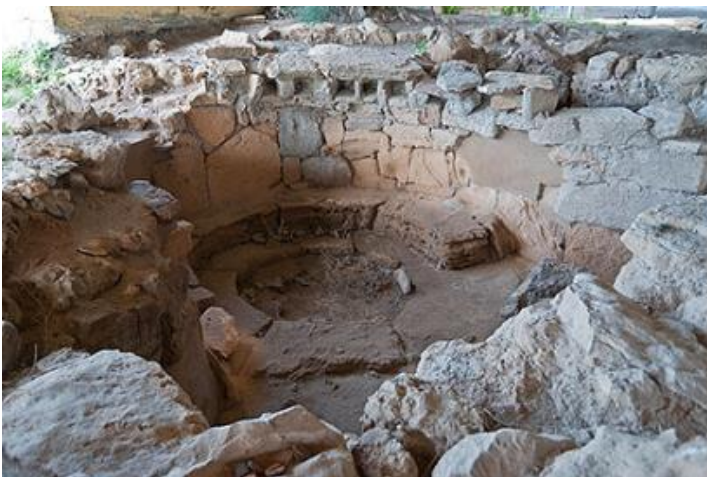
Situ de Sant'Imbènia_S'Alighera