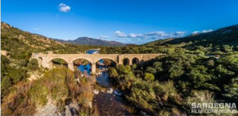
Ponti romanu in sa 125 bècia (Sarrabus)

materiali già conosciuti e lavorati in epoca prenuragica e nuragica. Nella zona di Sulci avevano fondato la cita Metalla, dove vivevano e lavoravano moltissimi minatori sardi.