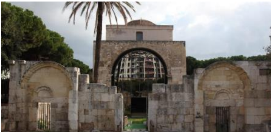
Pratza e crèsia de Santu Sadurru_Casteddu