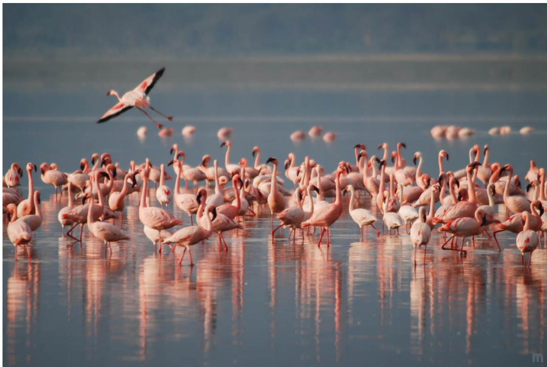
Staini de Molentàrgius