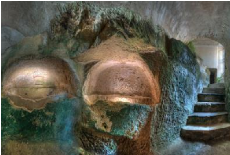
Necròpoli de Bonaria

Torraus a Karales, capitali de provìntzia, po unus cantus de àteras informatzionis.