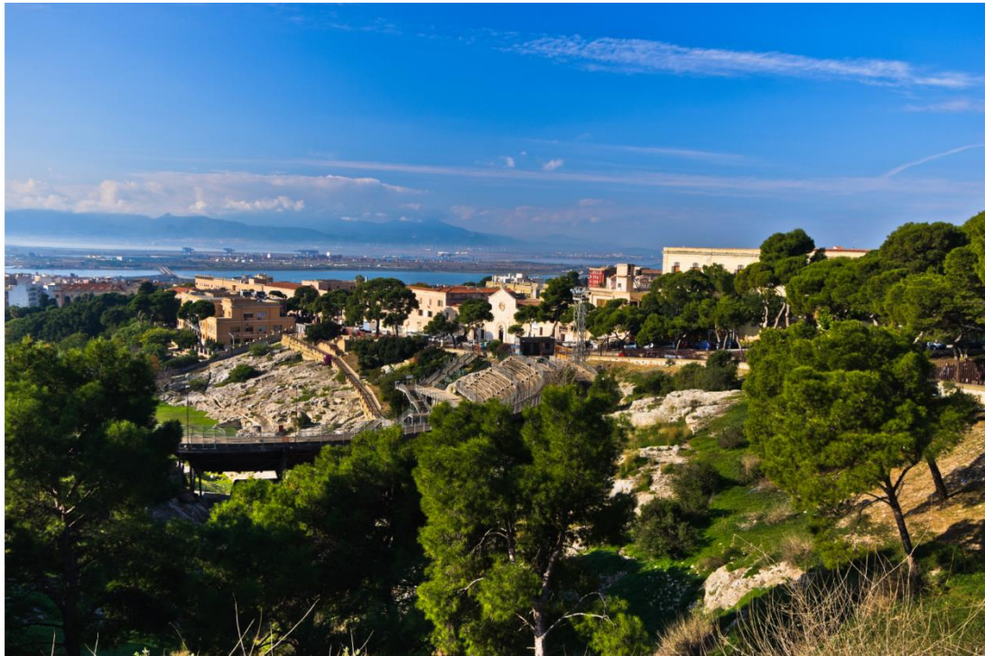
Anfiteatru de Casteddu

Àteru fàbbricu de importu est s'Anfiteatru , unu de is sìmbolus de is costruzionis romanas, stuviau in s'arroca de is ingegneris intre su I e su II sèc. a.C.